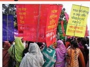
Mobilisation féministe à Dhaka au Bangladesh

Journée internationale pour l'élimination de la violence à l'égard des femmes